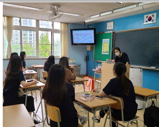
1차 연간일정 논의하기