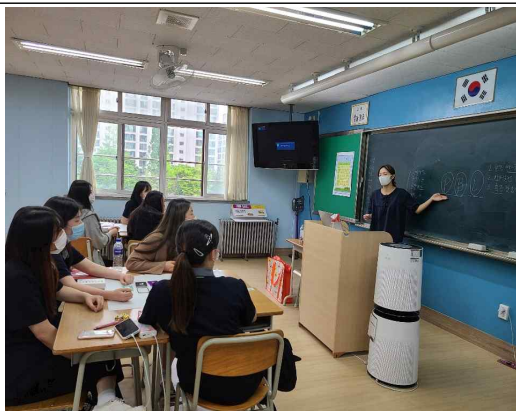
1차 사전인터뷰 활동 반추하기