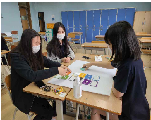
프로젝트 맛보기 (1)