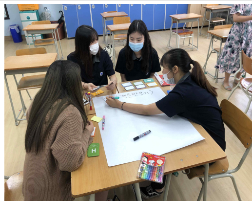
프로젝트 맛보기 (2)