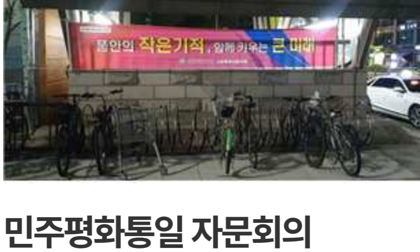
민주평화통일 자문회의 고양시협의회 고양시청, 화정역