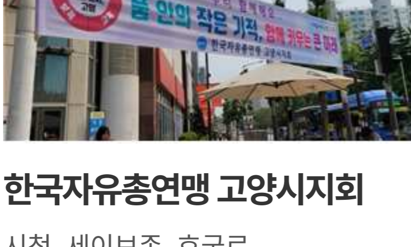
한국자유총연맹 고양시지회 시청, 세이브존, 호국로