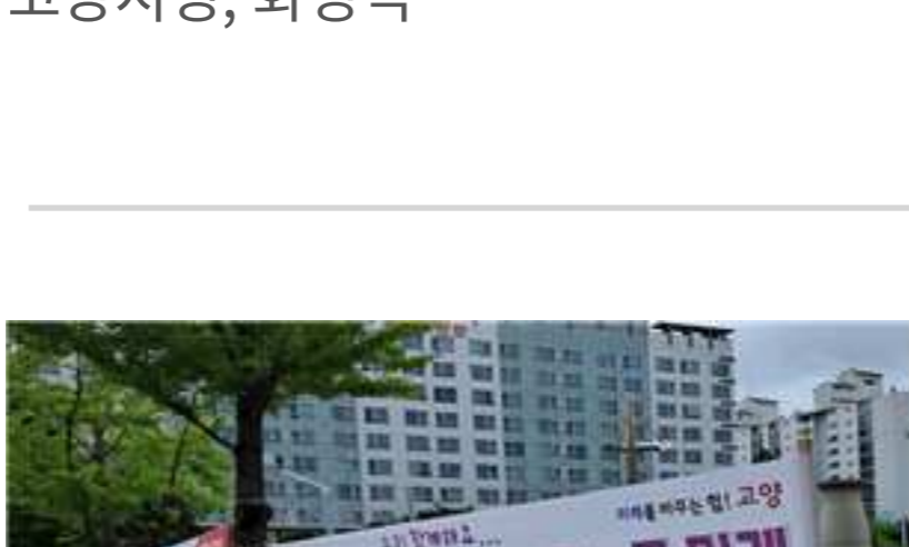
대한적십자사봉사회 고양지구협의회 고양시청, 대화역, 정발산동