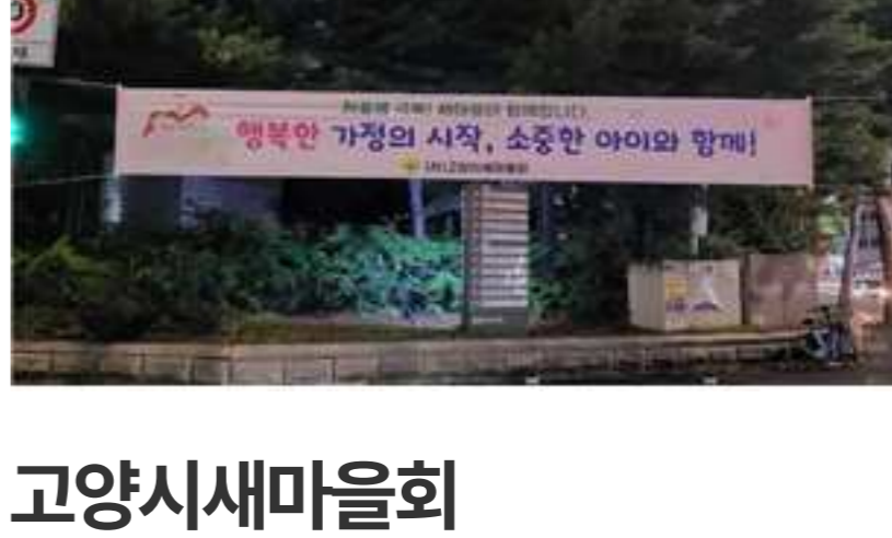
고양시새마을회 강선마을, 라페스타, 새마을회관, 아람누리, 원당역