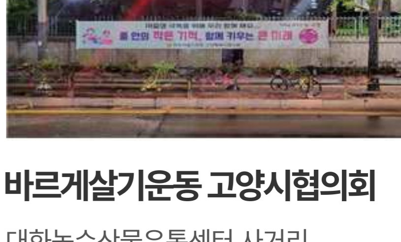
바르게살기운동 고양시협의회 대화농수산물유통센터 사거리, 문화광장, 덕양구청