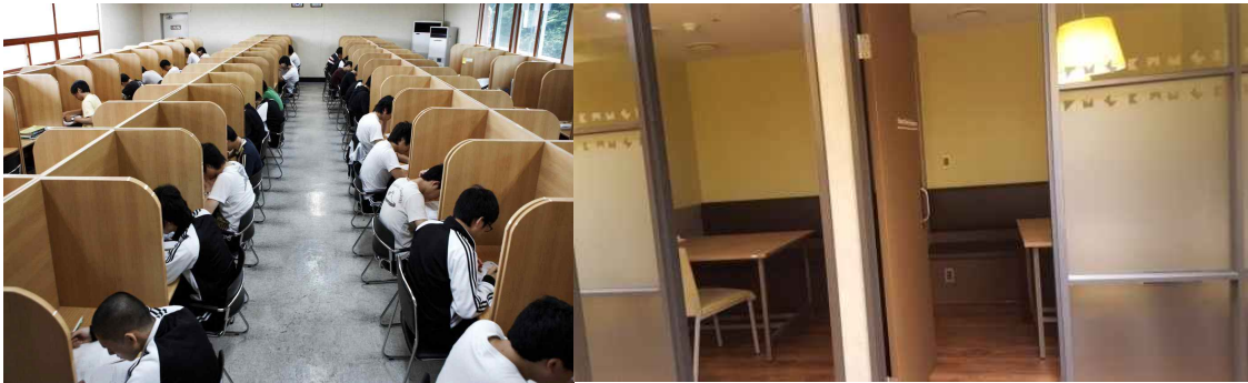
<예시 - 기존 공공독서실(좌), 사설독서실(우)>

4. 따라서 청소년들을 위한 독서실 공간을 조성하는 것을 시작으로 고양시청소년재단의 비전인 '청소년의 일상생활이 즐거운 고양시'와 전략과제 중 하나인 '청소년의 권리를 증진하는 것'을 실현 할 수 있는 좋은 기회이자, 더 큰 비전과 목표로 나아가는 밑바탕이 될 수 있다.